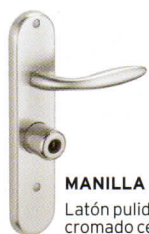
MANILLA Latón pulido o cromado cepillado